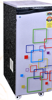
Galaxy + Model 4 2 HP