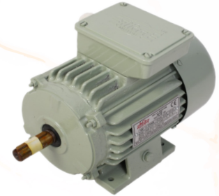
3 PHASE MOTORES C.R.N.O. (सीसीडीएन)