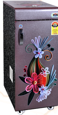
Digital + Model 3 1 HP