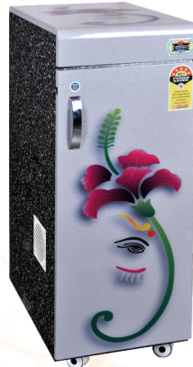
Light + Model 2 1 HP