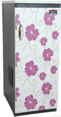
PLB Model 1 1 HP